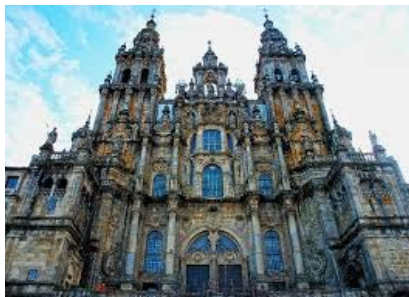
Fachada del Obradoiro

En el siglo XVIII: Fernando Casas Novoa (1670-1750), su obra maestra es la esbelta Fachada del Obradoiro en la Catedral de Santiago de Compostela (1738), se levantó delante del Pórtico de la Gloria del maestro Mateo de estilo románico.